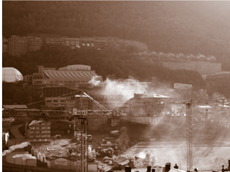
Desde casa