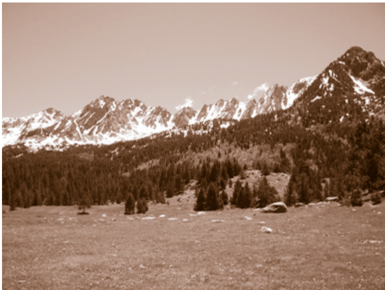
Pla de l'Estall Serrer