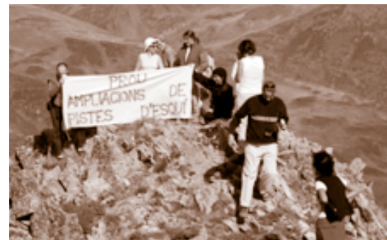
Sortida al pic de Pedrons

Els especialistes alerten dels efectes de l'escalfament global que portaran canvis amb les activitats relacionades amb l'esquí. Tenint en compte aquestes previsions, l'ampliació i creació de nous dominis esquiables com el de Porte des