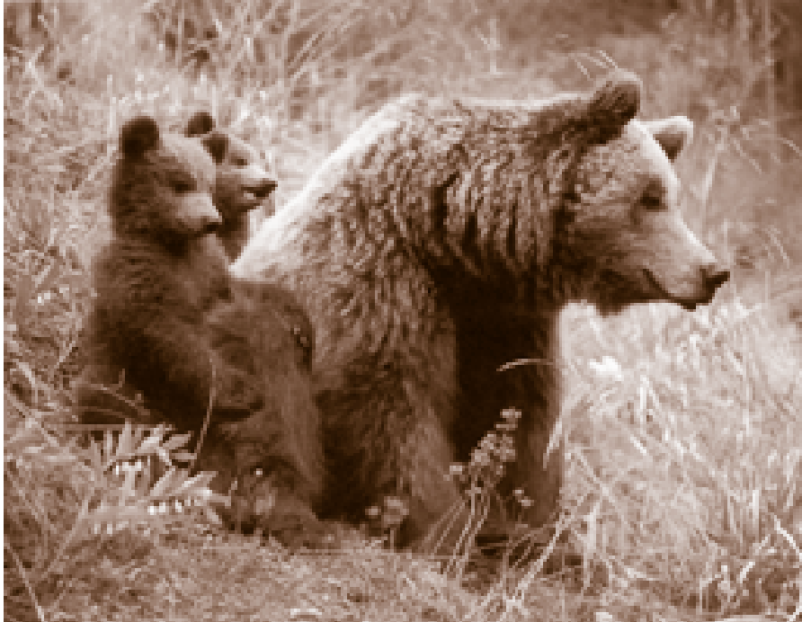
Os bru