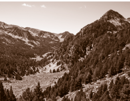
Vall del Madriu

Després de gairebé mig any de la declaració de la Vall com a Patrimoni de la Humanitat, el Govern va iniciar la incoació de l'expedient per a la seva protecció com a bé d'interès cultural.