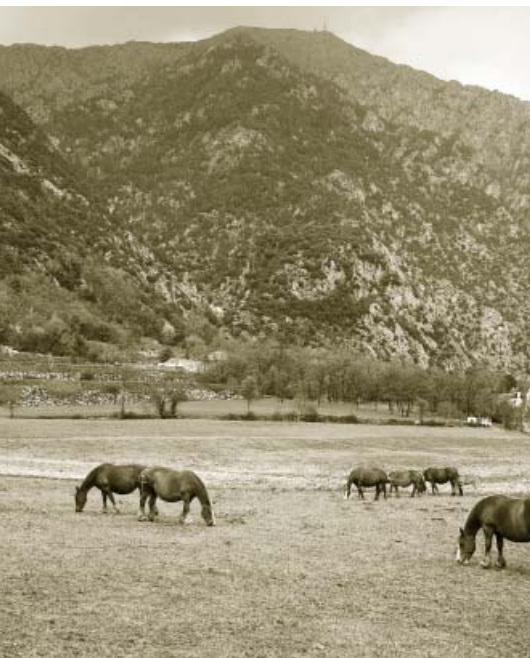
El valor agrari, ecològic i paisatgístic dels espais oberts que subsisteixen al fons de les valls principals fa que la seva conservació sigui prioritària.