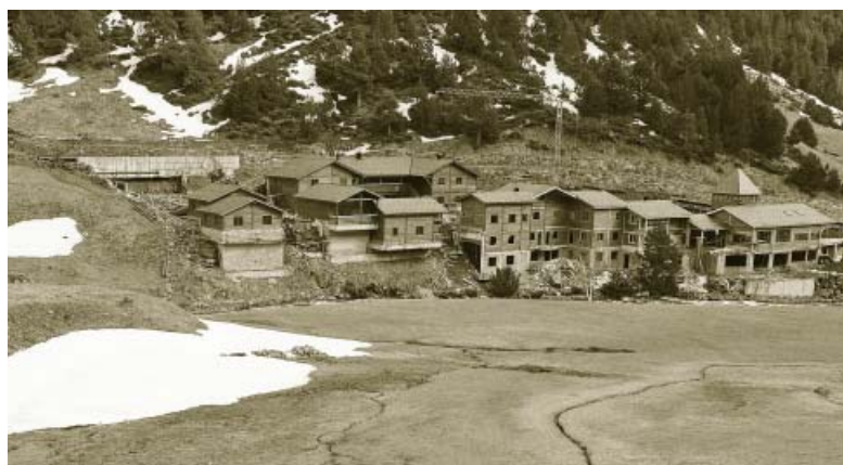
La vall d'Incles, una joia del paisatge andorrà amenaçada pel creixement urbanístic.

● El pla de Canillo preveu declarar urbanitzable la totalitat dels fons de les valls d'Incles i Ransol, a més de bona part de les valls de Montaup i del Riu i dels prats de Mereig, entre altres espais naturals d'altíssim valor ecològic i paisatgístic. En el cas de la vall d'In-