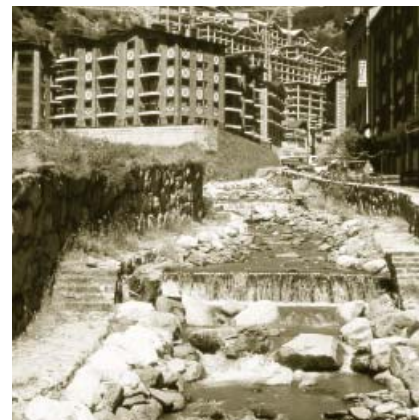
Com volem que siguin els nostres rius? Esquerra: bosc de ribera al riu d'Auvinyà. Dreta: riu d'Arinsal