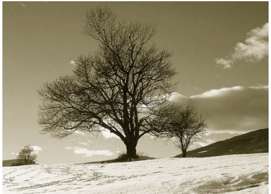
Alguns arbres tenen un valor cultural o simbòlic especial, i des de l'ADN els volem catalogar. En coneixes algun?.