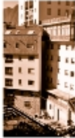
Una casa amb un pati de pedra de la ciutat d'Andorra.

El treball és... Presentem al·legacions als governs, què és això? En alguns casos caldrà un pla d'actuació... Presentem al·legacions als governs, què és això?