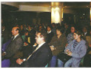
Una gran quantitat de públic va assistir en a presentació.

Hoquet també va explicar que el llibre és una obra de Andorra. Va explicar a l'ADN la seva idea "amb la seva obra, el país, un volum de caràcter patrimonial de la nova publicació "Pas a pas per Andorra".