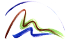
Col·legi Ciències de la Terra d'Andorra